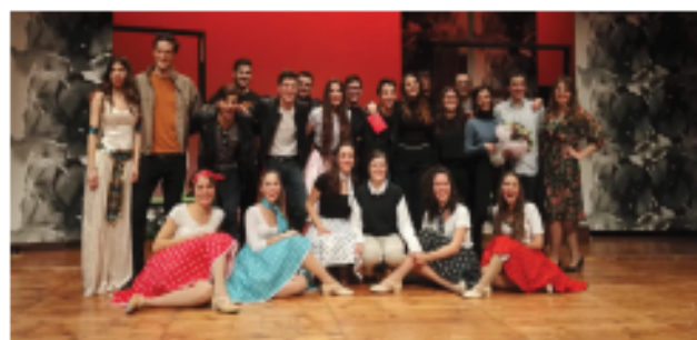
Un'immagine del cast dello spettacolo amatoriale UN PAIO D'ALI andato in scena con successo lo scorso 28 gennaio

Non ci resta che invitarvi in SALA ARGENTIA cinema teatro per ammirare la bravura di questi interpreti e decidere insieme a noi i vincitori della rassegna.